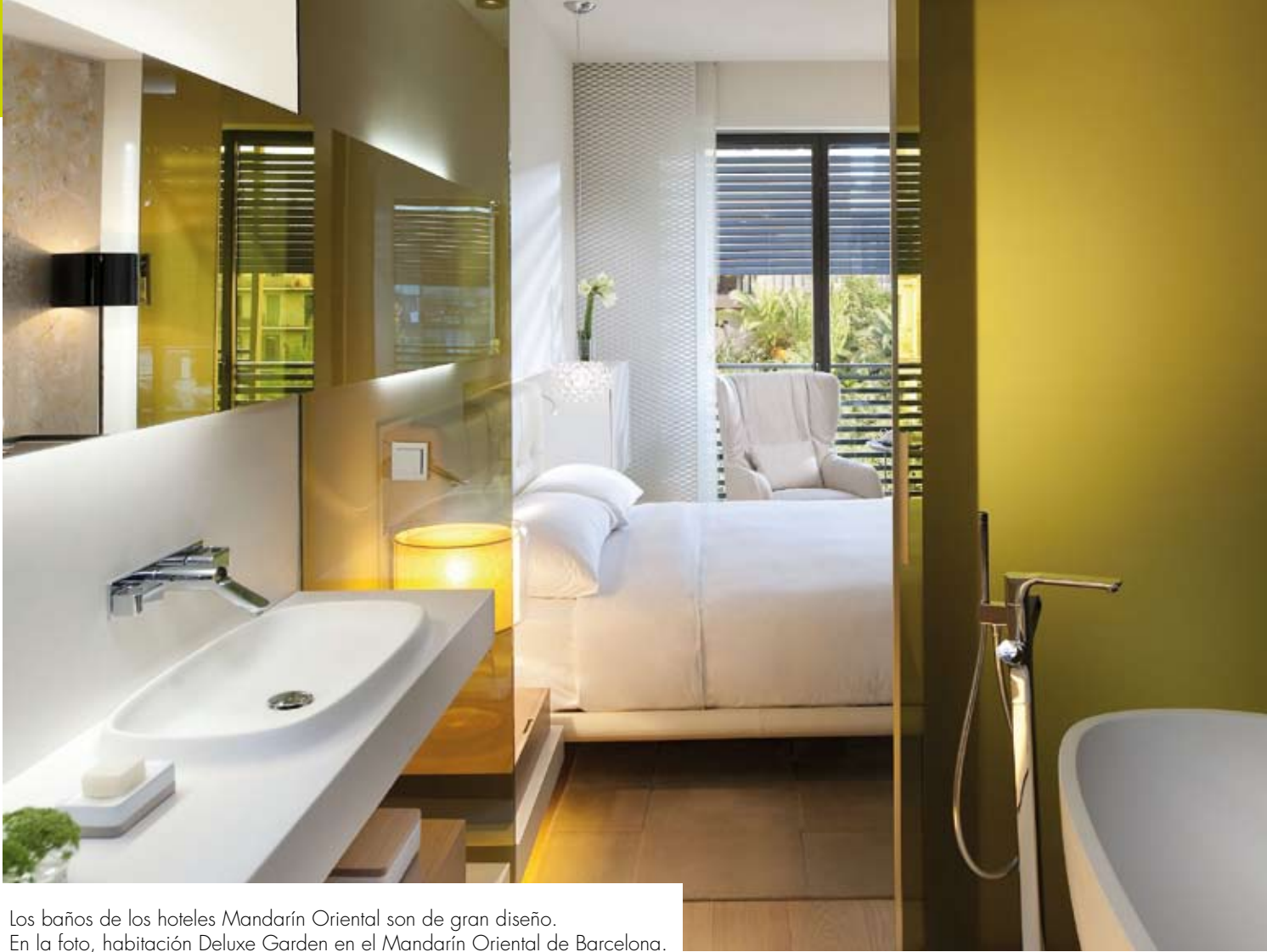
Los baños de los hoteles Mandarin Oriental son de gran diseño. En la foto, habitación Deluxe Garden en el Mandarin Oriental de Barcelona.

Bañeras que se integran en las habitaciones, vistas de ensueño, uso de materiales naturales, decoración y tecnología para despertar los sentidos... El diseño de los baños ha adquirido una relevancia inesperada como factor clave para la valoración de la estancia por parte de los huéspedes y la mejora de la gestión hotelera.