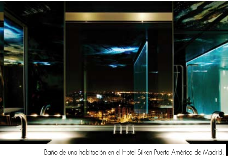
Baño de una habitación en el Hotel Silken Puerta América de Madrid.