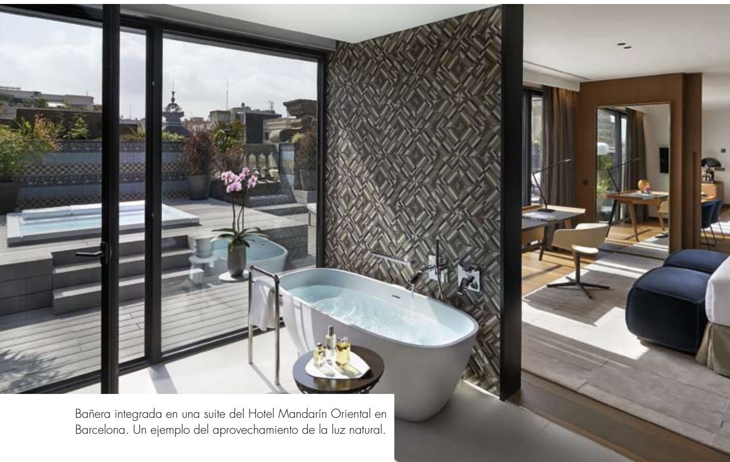
Bañera integrada en una suite del Hotel Mandarin Oriental en Barcelona. Un ejemplo del aprovechamiento de la luz natural.