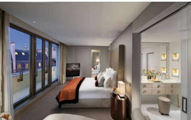
Dormitorio de la suite Couture en el Hotel Mandarin Oriental de París.

ción de acabados y detalles resistentes permite “minimizar el tiempo necesario de limpieza, reducir la necesidad de mantenimiento y maximizar la durabilidad del espacio”, agrega Navas. Está claro que resulta muy interesante considerar todos los aspectos que puedan ayudar a reducir el riesgo de desgaste de los baños.