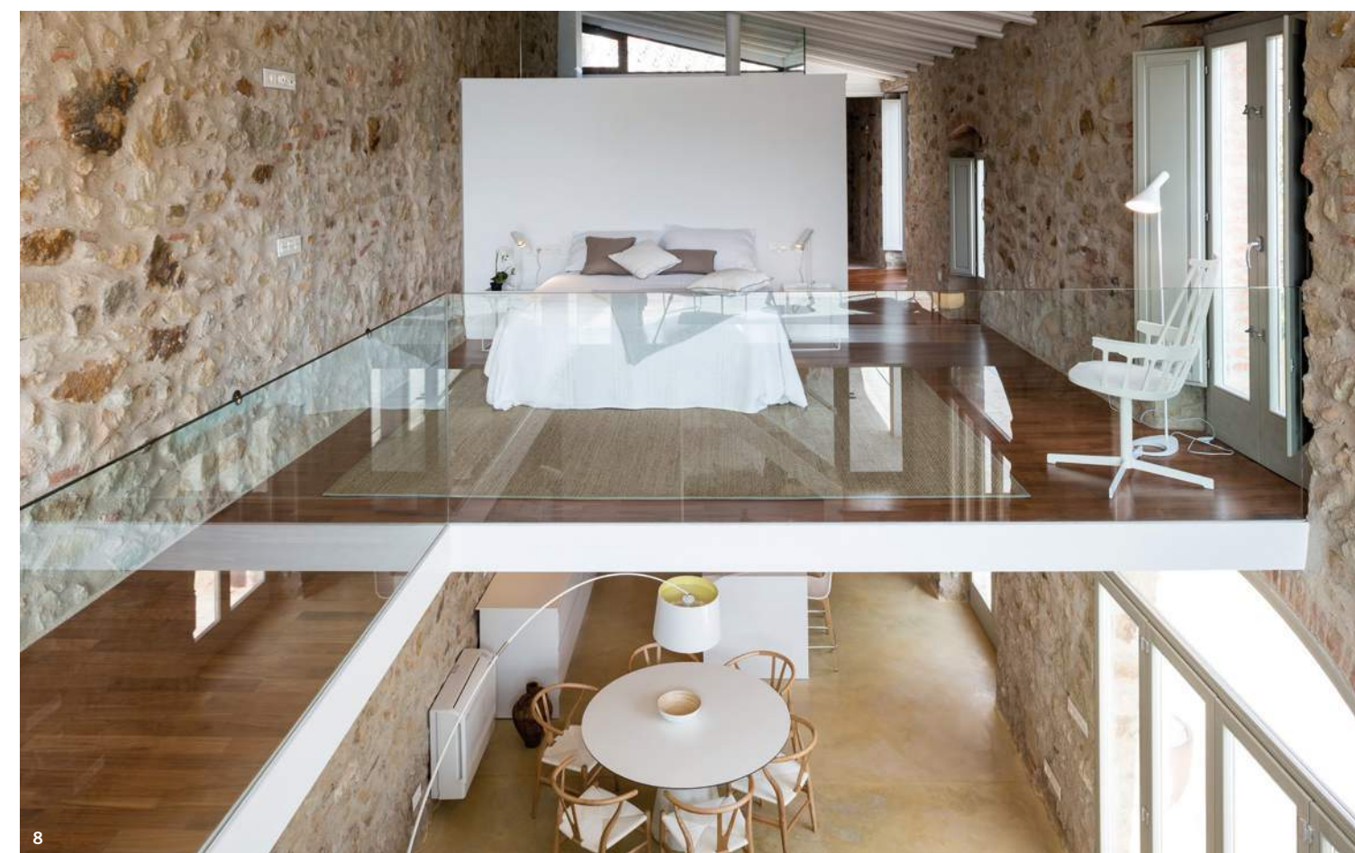
7/Con mesa y butacas de Andreu World, el estudio de la planta alta asoma a la doble altura del estar. 8/Vista del dormitorio, con butaca giratoria de Kartell. Debajo, el comedor, con mesa de Andreu World y sillas CH 24 de Hans J. Wegner.

puede transformarse en una habitación tipo suite si las necesidades lo requieren.