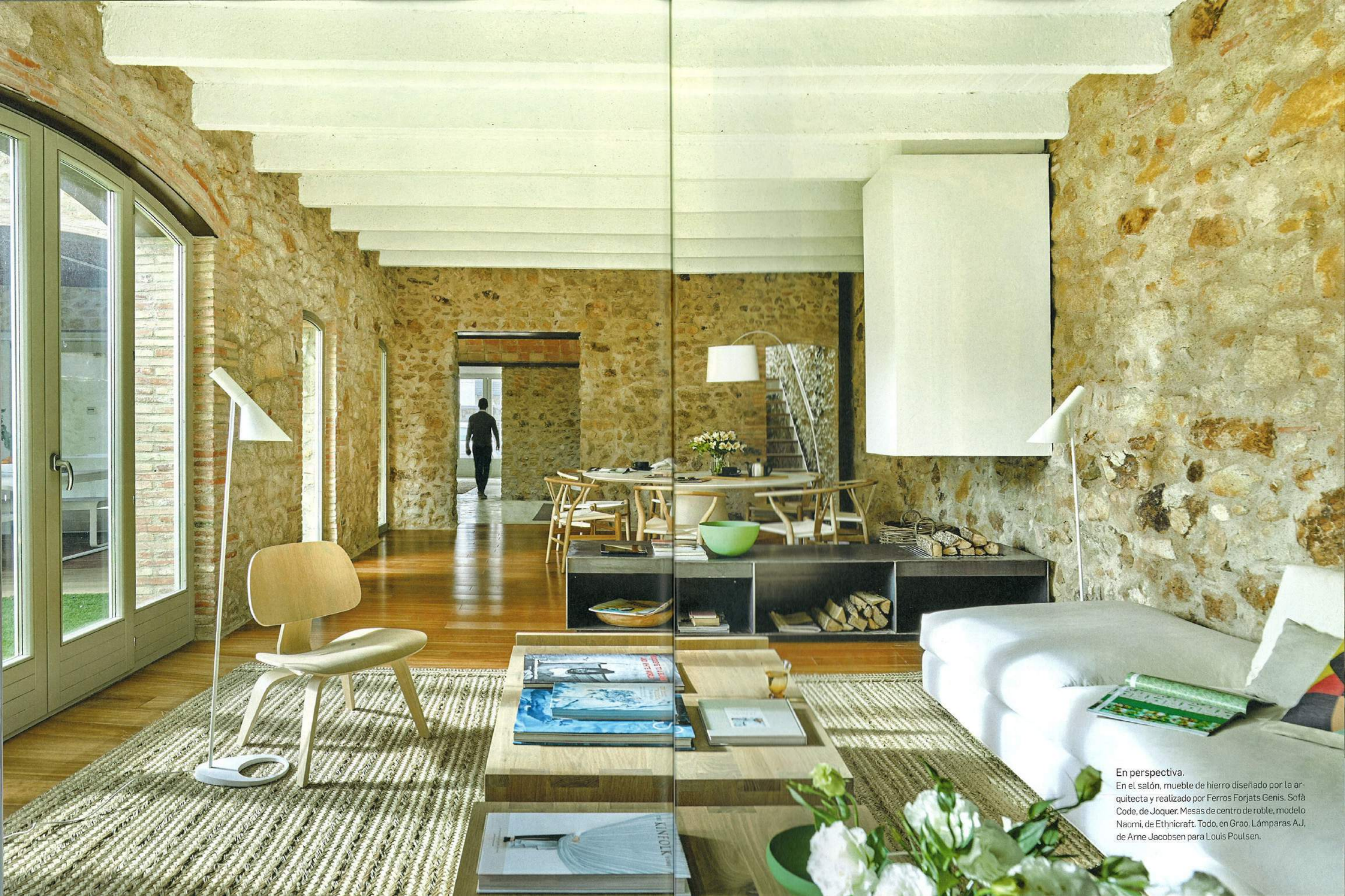
En perspectiva. En el salón, mueble de hierro diseñado por la arquitecta y realizado por Ferros Forjats Genis. Sofà Code, de Joquer. Mesas de centro de roble, modelo Naomi, de Ethnicraft. Todo, en Grao. Lámparas AJ, de Arne Jacobsen para Louis Poulsen.