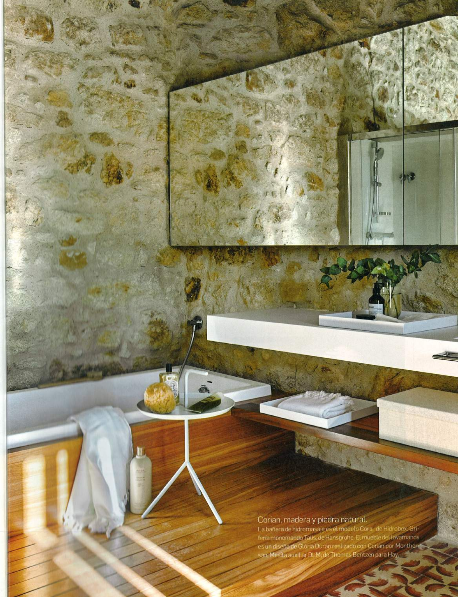
Corian, madera y piedra natural. La bañera de hidromasaje es el modelo Cora, de Hidrobex. Critería monomando Talis, de Hansgrohe. El mueble del lavamanos es un diseño de Glòria Duran realizado con Corian por Monther-san, Mesita auxiliar DLM, de Thomas Bentzen para Hay.

la visión del patio se amplía, en el marco de una hermosa "volta catalana". Y, al entrar en la cocina-office el patio continúa visible a través de grandes cristalerías. El pavimento de hormigón de esta zona da paso al suelo de madera del comedor y, en el medio, una chimenea (diseño del propio estudio), con campana y mueble de hierro barnizado. En la planta alta, una majestuosa galería de arcos (con suelo de toba manual) se abre al patio e ilumina profusamente las estancias. El recuperado pavimento de baldosas hidráulicas decora con su elegante simplicidad la suite principal y las habitaciones. En el exterior, bajo unas arcadas y sobre una tarima de madera de ipé, los dueños de casa disponen de un comedor de verano, con una barbacoa de hierro y una buganvilla que no para de florecer. Y un ciprés en el jardín, con piscina y una salida de agua a la manera de una escueta cascada. El interiorismo casi enteramente blanco y contemporáneo contribuye a la nueva vida de la vieja piedra. El tiempo transcurre con limpieza en estos ámbitos. ■